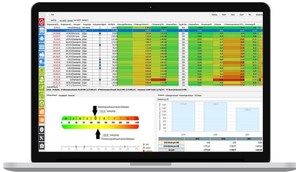
Ein detailliertes CO 2 -Monitoring zeigt gebäudespezifische Energieeffizienzpotenziale auf und hilft strategisch und wirtschaftlich sinnvolle Konzepte zu entwerfen.

Wohnungsunternehmen haben noch nie so viele Hebel in Bewegung gesetzt, den Energieverbrauch von Gebäuden zu senken, wie derzeit. Wer weniger Energie verbraucht, kann Kosten in ungeahnter Höhe sparen und den CO 2 -Ausstoß verringern. Und zwar